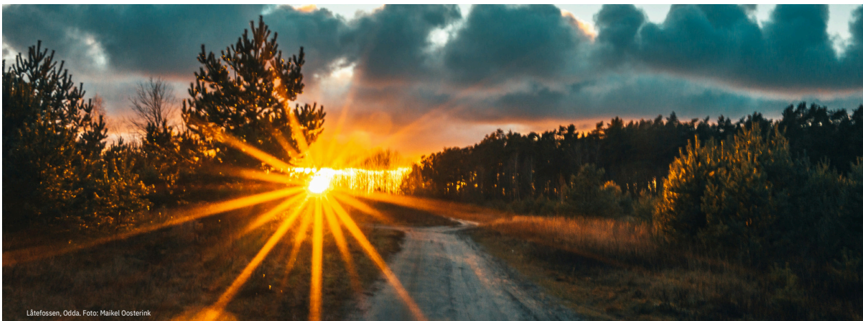
Låtefossen, Odda.

USS deler regjeringens syn både på behovet for å styrke naturpolitikken og viktigheten av kommunene som en hovedaktør i all arealplanlegging og forvaltning. Dette ga USS uttrykk for også ved andre anledninger, blant annet på landsmøtet i april og i høringsuttalelsene til regjeringens forslag til nye statlige planretningslinjer for areal og mobilitet og for energi og klima. Disse ble vedtatt 20. desember 2024 av Kongen i statsråd, og gir tydelige føringer for kommunene om vektleggingen av klima og energi i planleggingen etter plan- og bygningsloven. Hovedbudskapet er at i all arealplanlegging skal det legges til rette for løsninger som reduserer klimagassutslippene og sikrer klimatilpasninger.