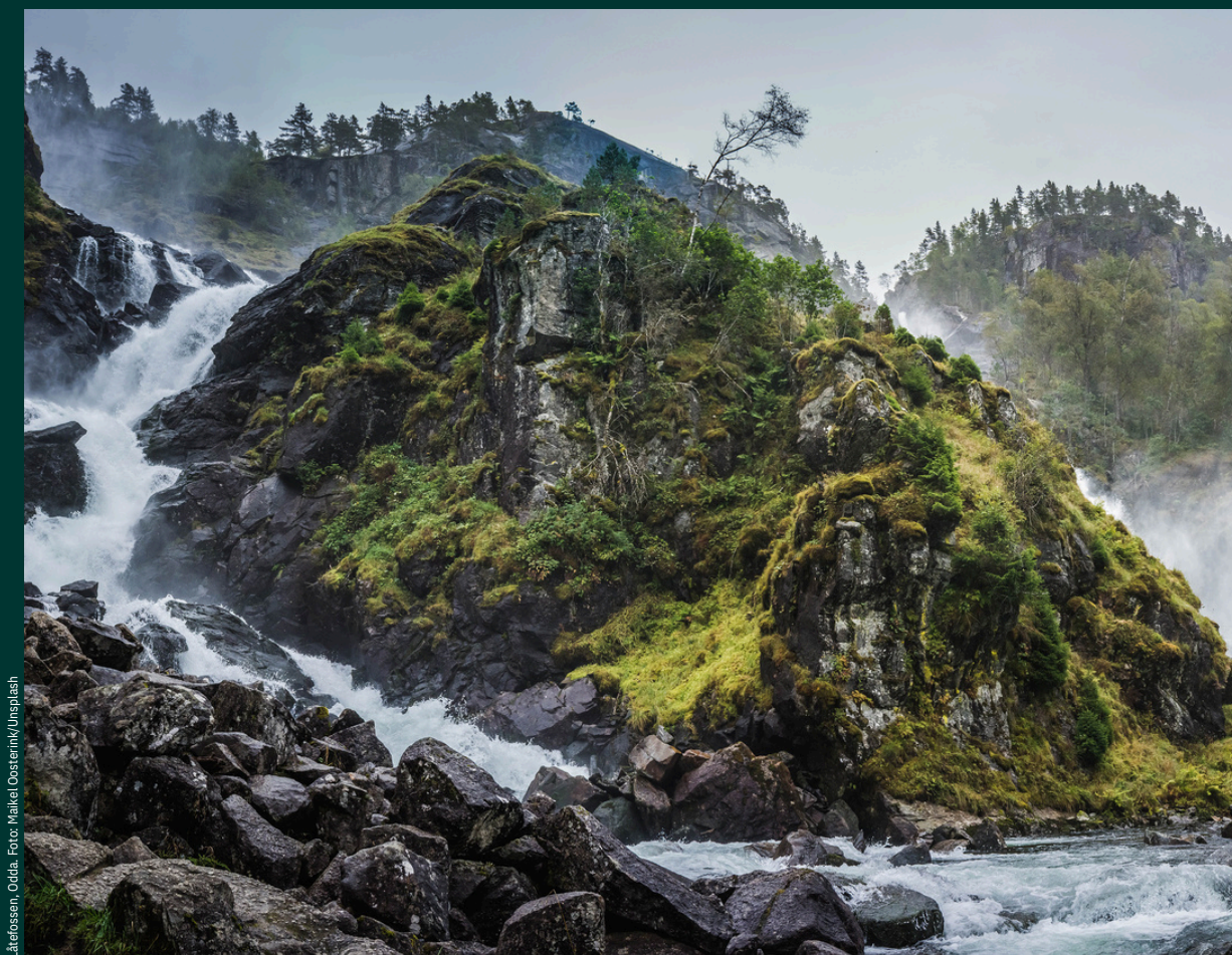
Låtefossen, Odda.

«Utmarkskommunenes Sammenslutning skal arbeide for å fremme medlemskommunenes interesser i utmarksspørsmål av enhver karakter. Utmarkskommunenes Sammenslutning skal søke å styrke det lokale selvstyret i saker om forvaltning av utmark og bedre samspillet mellom hensynet til natur- og miljøvern og lokal næringsutvikling. Utmarkskommunenes Sammenslutnings arbeid skal skje innenfor de rammer en bærekraftig utvikling og livskraftige lokalsamfunn tilsier.»