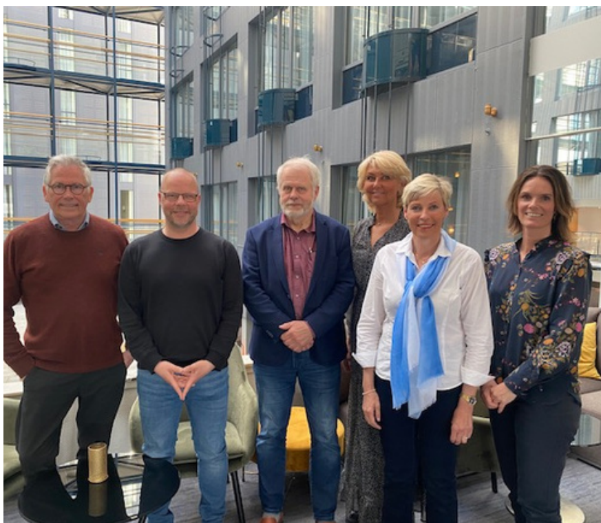
Hytteutvalget på USS landsmøte 2022.

Hytteutvalget har også inngitt innspill til Inntektssystemutvalgets rapport (se nærmere nedenfor).