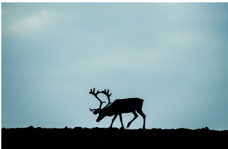
Reinsdyr i Jotunheimen Nasjonalpark.

USS involverte seg umiddelbart i saken og erklærte partshjelp til støtte for Staten i etterfølgende muntlige forhandlinger for tingretten i starten av januar 2022. Oslo tingrett avsa ny kjennelse 13. januar der fellingsforbudet ble opprettholdt. Staten anket umiddelbart, og USS erklærte samtidig partshjelp også i ankesaken. I Borgarting lagmannsrett kjennelse 3. februar 2023 fikk Staten (og USS) medhold i at vedtaket om lisensfelling av ulv innenfor ulvesonen denne vinteren er lovlig. Lisensfelling ble deretter iverksatt umiddelbart.