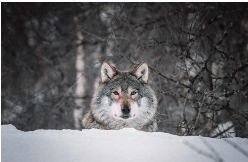
Ulv i Norge.

I juni 2021 avsa Oslo tingrett dom om at Klima- og miljødepartementets vedtak om lisensfelling av Letjenna-reviret i Åmot kommune i 2019 var ugyldig. USS var ikke partshjelper for tingretten, men erklærte partshjelp til støtte for staten i ankeforhandlingen for Borgarting lagmannsrett.