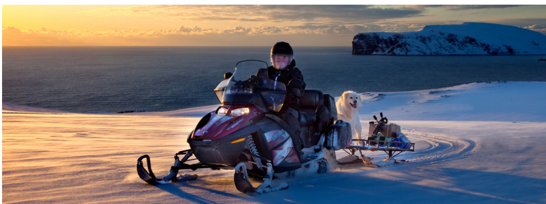
Motorferdsel i Nord Norge.

USS vil følge utvalgets arbeid tett også i 2023.