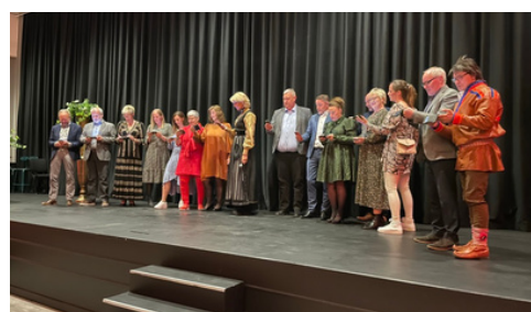
Uss landsmøte 2022.