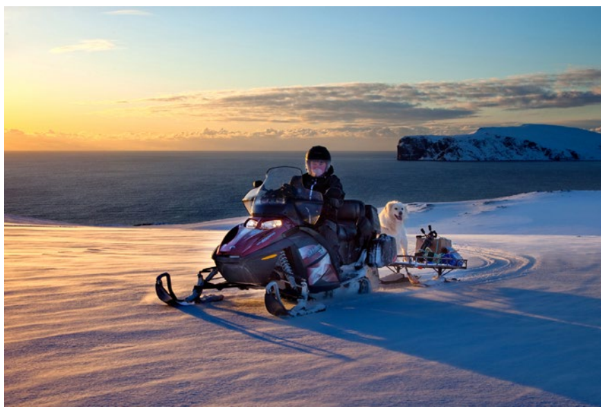
Motorferdsel i Nord-Norge.

Formålet med kartleggingen er å undersøke hvor stor andel av kommunens areal den faktisk kan disponere over i sin arealplanlegging. Mange av USS-kommunene er store målt i antall kvadratkilometer, men kartleggingen viser foreløpig at mange kommuner må forholde seg til at opp mot 80 % av arealene av ulike grunner ikke kan utnyttes.