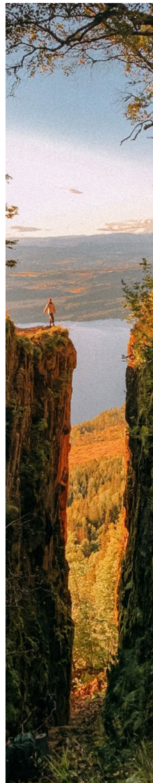
Cyrihaugen, Honefoss.