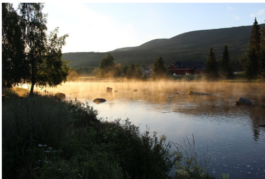
Hallingsskarvet nasjonalpark.

USS/Mineralkommunene har i 2021 hatt møter både med utvalgets sekretariat og med utvalget, og har kommet med flere innspill til det videre lovarbeidet. Det er fremholdt at det