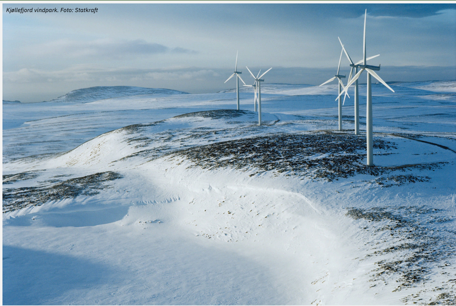
Kjøllefjord vindpark.