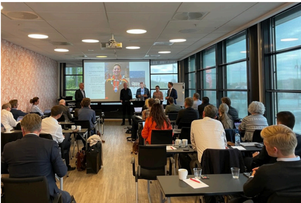
LNVK landsmøte 2023