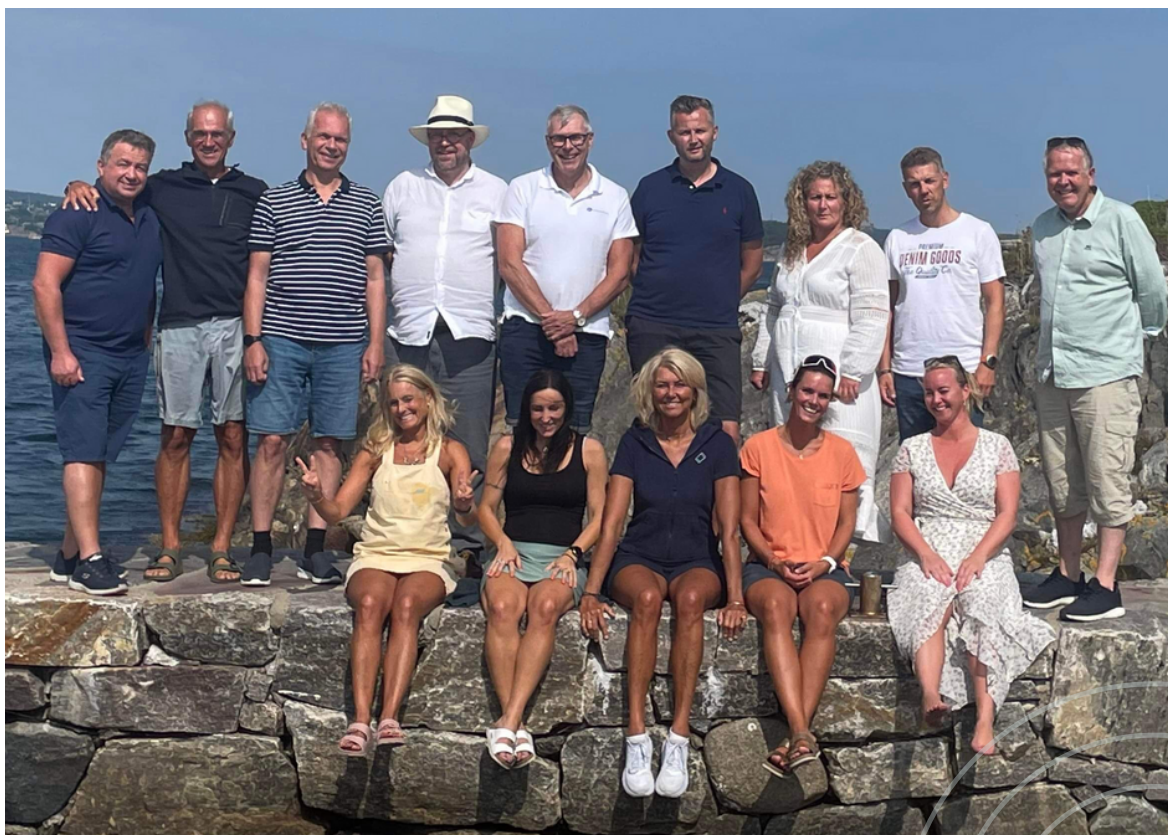
Styret i Naturressurskommunene på Rivingen 2022.

LNVK har også hatt et godt og nært samarbeid med vindkraftbransjen, representert med NORWEA/Fornybar Norge. Her også KS deltatt. Gjennom samarbeidet har partene arbeidet for å bli enige om innspill til myndighetene om politikktutforming, høringsuttalelser m.v.