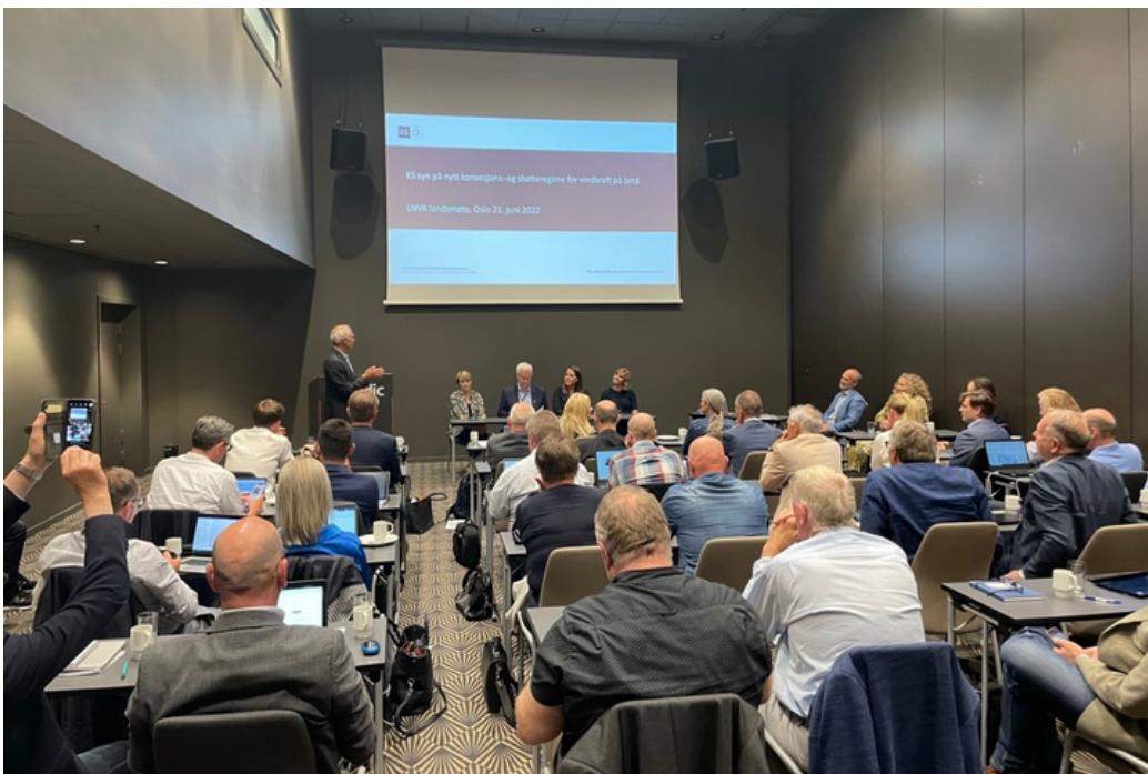
LNVK landsmøte 2022